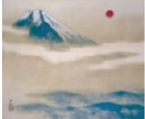
勅題画 横山大観「朝陽映島（ちようようしまにえいず）」昭和14年