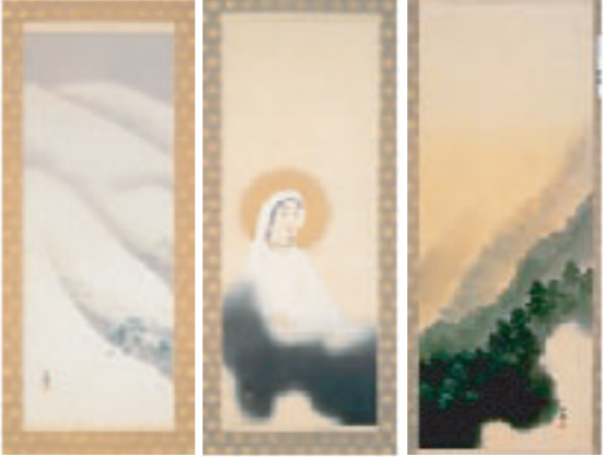
三幅対 横山大観「観音春冬山水図」大正7年頃